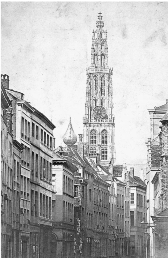
Antwerpen: een pistool gericht op Engeland.

Ik denk dat Frankrijk dat laatste wél wil. Het wil Wallonië wél domineren, maar