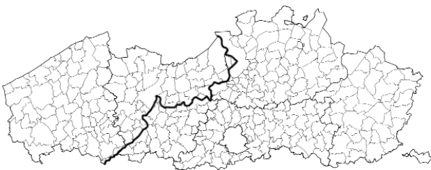
De middeleeuwse grens: Vlaanderen ten westen van de Schelde behoorde tot Frankrijk

Op „de Vlaanders”, onze twee provincies ten westen van de Schelde, heeft Frankrijk zelfs historische claims. „On nous a volé la Flandre,” hoort men in Vlaanderen wonende franskiljons soms vandaag nog vertellen wanneer zij zich ergeren aan de bestuurlijke ééntaligheid van het Vlaamse gewest. Er zit zelfs waarheid in die bewering.